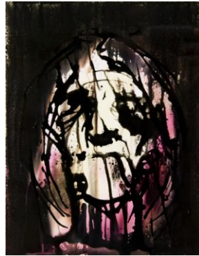
Apallissada (Quimiografia, 30 x 24 cm. de Llorens Ferri)

El congreso tiene carácter interdisciplinar y ha sido planteado en función de los intereses científicos compartidos por los grupos de investigación que lo organizan. Ese carácter nos permite contar con comunicaciones y ponencias de las distintas disciplinas humanísticas que abordan el tema de la historia y las poéticas de la memoria del franquismo, y sus proyecciones hacia Europa y Latinoamérica. De ese modo confiamos en poder abrir las puertas a nuevos enfoques, colaboraciones interdepartamentales, metodologías de trabajo y propuestas conceptuales que resultarán útiles para complementar los estudios transversales realizados desde las diferentes disciplinas y líneas de investigación.