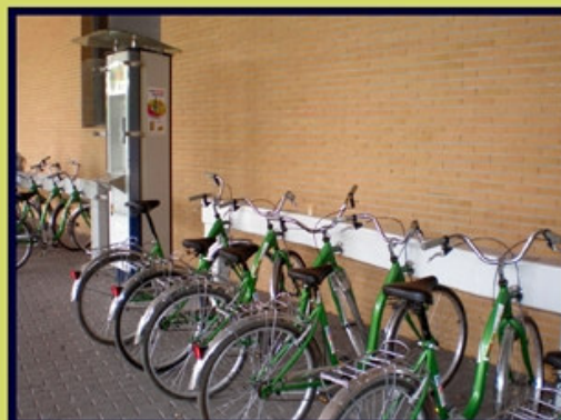
Estació de lloguer de bicicletes/ Estación de alquiler de bicicletas (Bicisanvi, Ayto. San Vicente)