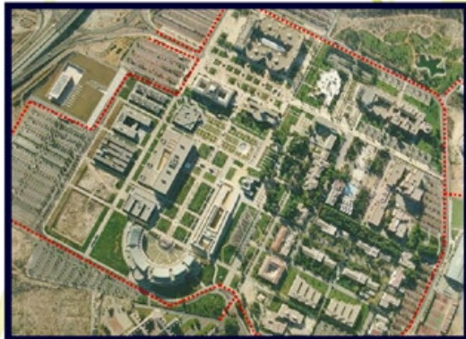
Zona lliure de trànsit rodat / Zona libre de tráfico rodado: 83 % del Campus

Un Campus per a Vianants i Bicicletes / Un Campus para Peatones y Bicicletas