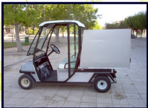
Vehicles poc contaminants/ Vehiculos poco contaminantes