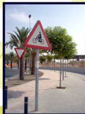
Carril bici d'accés al Campus/ Carril bici de acceso al Campus