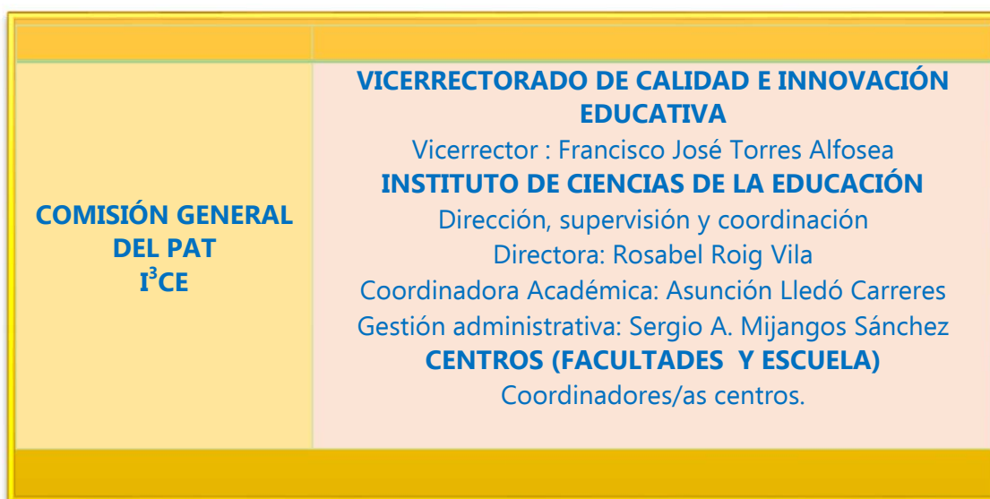
Figura 1. Composición y funciones asignadas a los miembros de la CG-PAT.

La gestión en la organización y coordinación del PAT corresponde a la Comisión General del PAT (CG) y dentro de la misma están delimitadas una serie de funciones como se indica en la figura 1: