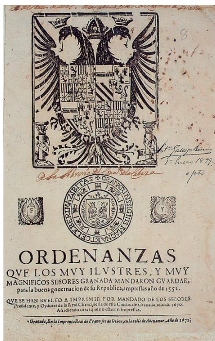
Fotografía 1. Portada. Título de las Ordenanzas que los muy ilustres y muy magníficos señores Granada mandan que se guarden para la buena gobernación de su república. Granada. 1552. (2ª Impresión por Francisco de Ochoa, 1678)

Signatura: CF-24.