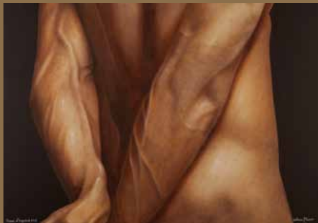
HOME D'ESQUENA 2018 (detall)