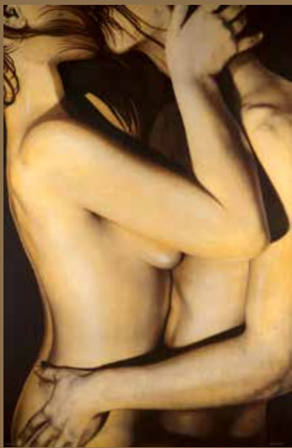
AMOR NU 2018