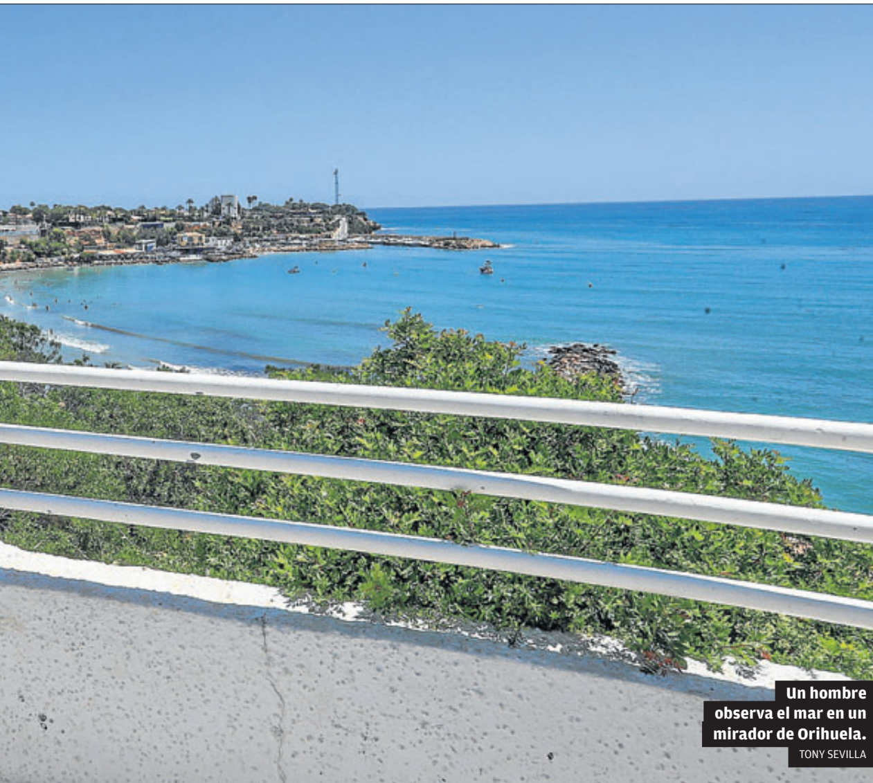
Un hombre observa el mar en un mirador de Orihuela.