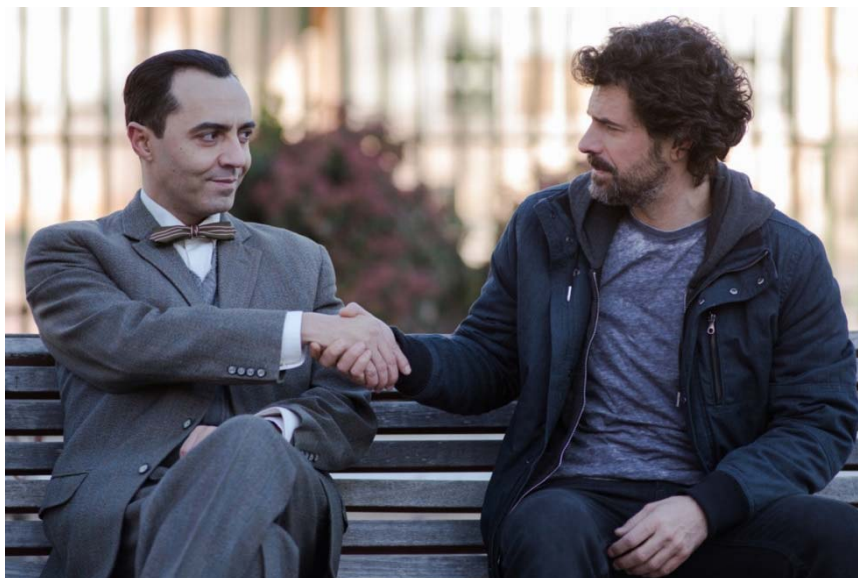
Figura 2. Julián, uno de los protagonistas, con Federico García Lorca. Capítulo 8. Primera Temporada

contenida buena parte de la cultura y la tradición del mundo, porque son modelos de la escritura literaria”, (Cerrillo, 2007:67).