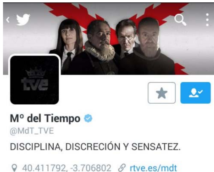
Imagen 2. Perfil de Twitter adaptado para el último capítulo de la 2ª Temporada

También a través del móvil hay campañas más específicas, como el grupo de Whatsapp del Ministerio, donde los espectadores entran por invitación, según preguntas sobre los contenidos de la serie y se les plantean nuevos retos http://www.rtve.es/television/20160127/grupo-whatsapp-ministerio-del-tiempo-segunda-temporada/1291164.shtml .