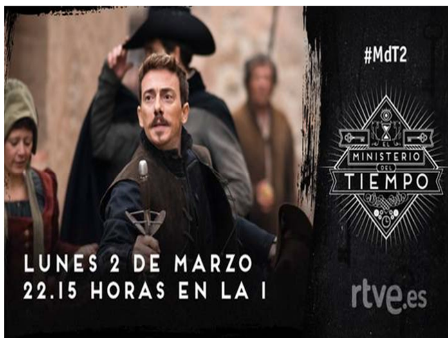
Figura 1. Publicidad de la segunda temporada

Es cierto que muchos de estos relatos audiovisuales se basan en buscar el éxito comercial y en agradar al máximo número de espectadores, muchas veces sin grandes expectativas artísticas. Pero también hay series que muestran una calidad excepcional y pueden ser interpretados en múltiples niveles y ofrecen alicientes tanto a adolescentes, espectadores y lectores en formación como a personas adultas con una rica competencia literaria. Este es el caso de El Ministerio del Tiempo , que ha despertado el interés entre espectadores jóvenes, que aprenden muchas cosas con sus capítulos, y espectadores adultos que disfrutan identificando las múltiples referencias históricas y literarias.