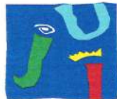
UNIVERSITAT JAUME I