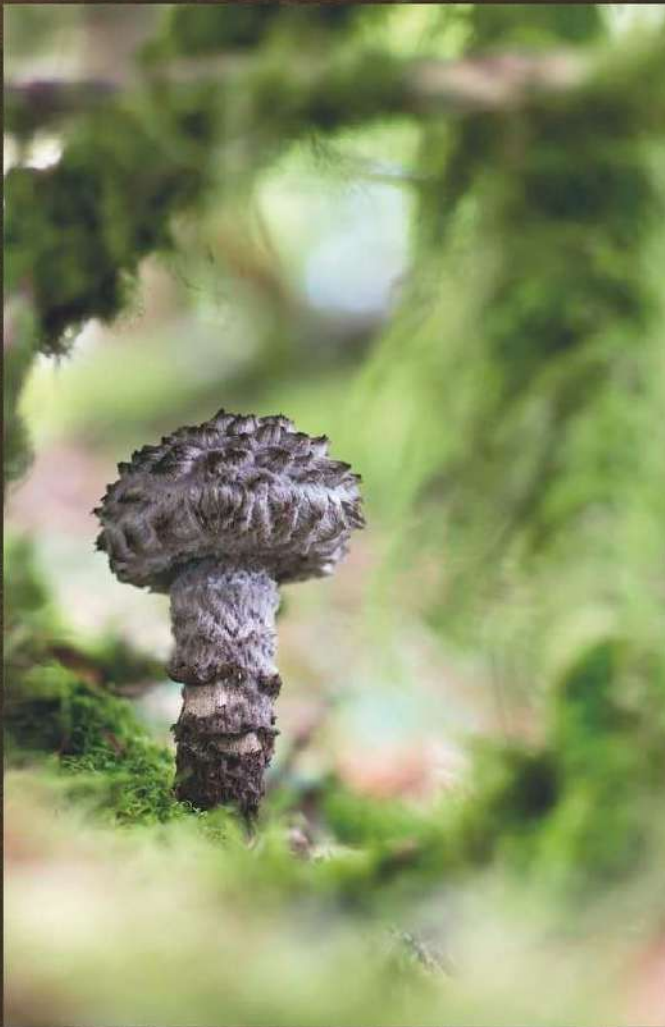
Autor: Alex Alonso Puente. Segundo Premio 2018 Categoría General.