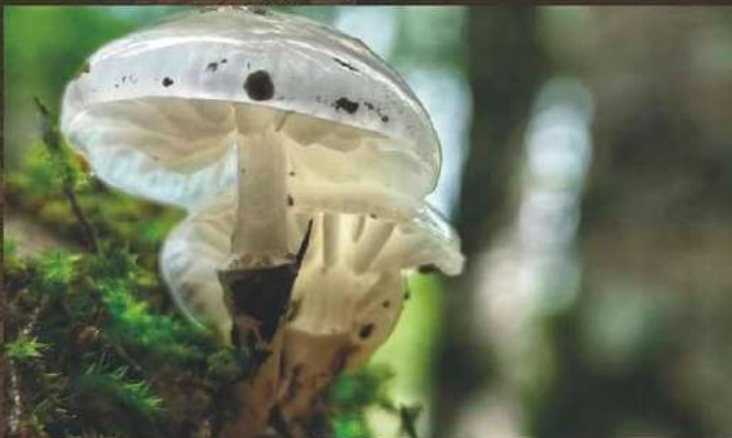
Autor: Antonio García Pertusa. Segundo Premio 2018 Categoría Socios.