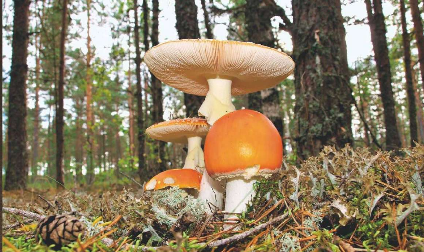
Autor: Roberto Sánchez Pérez. Primer Premio 2018 Categoría Socios.

03.11.19 - EXCURSIÓN MICOLÓGICA organizada por ASOMA* (Lugar y hora de salida por determinar según climatología).