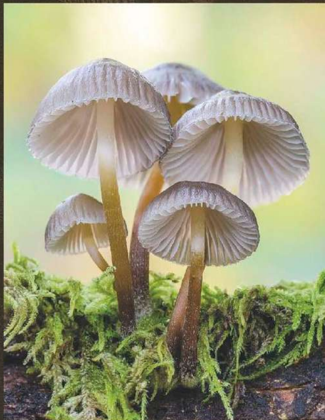
Autor: Alfredo López de Arriba Pérez de San Román. Primer Premio 2018 Categoría General.

*Inscripciones para excursiones y taller gastronómico, contactar con ASOMA (623104905).