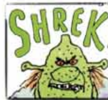
Shrek (William Steig)