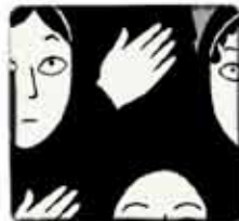
Persépolis (Marjane Satrapi)