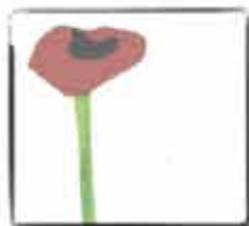
Fréderick (Leo Lionni)

742126 2 créditos de libre elección* 20 horas ICE *Titulaciones a extinguir