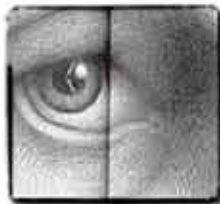
La invención de Hugo Cabret (Brian Selznik)