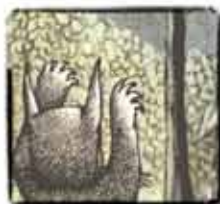
Donde viven los monstruos (Maurice Sendak)