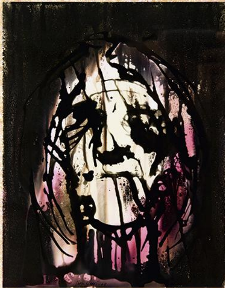
Apallissada (Oulmiografia, 30 x 24 cm. de Llorens Ferrí)

EXPOSICIÓ: UNA MIRADA IRÒNICA de Rafael Llorens Ferrí Inauguració el dia 20 a les 19.45 h.