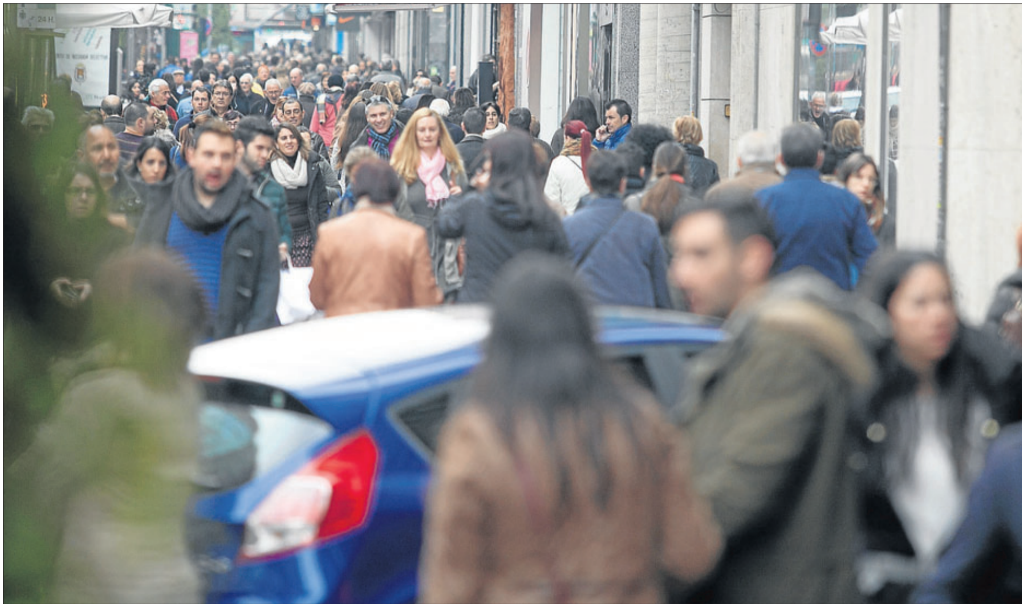
Viandantes en una de las principales avenidas de la ciudad de Alicante. ISABEL RAMÓN