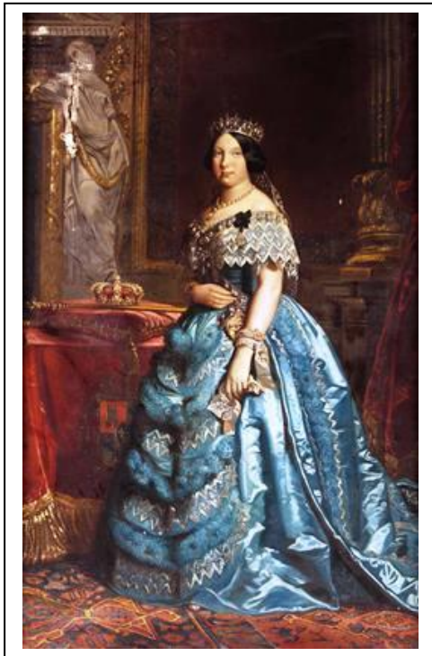
Imagen 3: Retrato de Isabel II