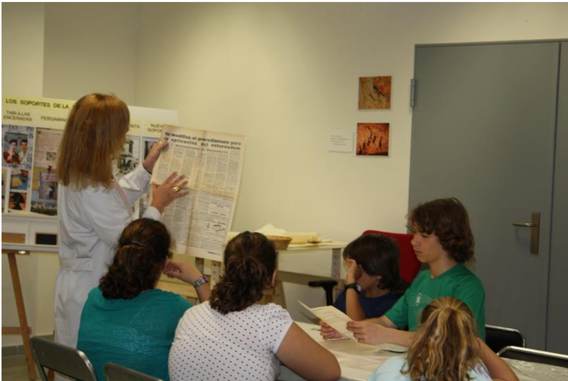
Imagen 8: Aula didáctica del AHPA

Seguidamente el grupo se dividió en dos; mientras unos acudían al aula didáctica para visualizar algunos de los documentos previamente seleccionados de los fondos comentados más arriba, como folletos, panfletos, pegatinas, censos electorales, recuentos, etc., el otro grupo acudió a la sala de usos múltiples donde se habían colocado las mesas electorales y una especie de cabina de votación para introducir en un sobre la papeleta del partido que habían decidido votar. Una vez hecho esto, procedían a mostrar su tarjeta identificativa (DNI) y se corroboraban sus datos en el censo-lista de clase y realizaban la votación. Finalizado el proceso, volvimos a reunir al alumnado en el salón de actos para efectuar un recuento público y proclamar al partido vencedor. Cabe resaltar el sorprendente realismo y entusiasmo con que se realizó la votación. Los alumnos se mostraban motivados y con ganas de poder vivenciar todo el proceso, desde la cabina electoral hasta su identificación y votación en la urna. Esta actividad enseñó indirectamente al alumnado la importancia de respetar la privacidad de las personas y ser tolerantes, independientemente de sus opiniones y convicciones. Por otro lado, la visualización de los documentos relacionados se desarrolló de una forma amena, procurando utilizar un vocabulario muy cuidado y cercano a ellos. Se iban explicando las diferentes fuentes, que observaban y analizaban mientras las manipulaban.