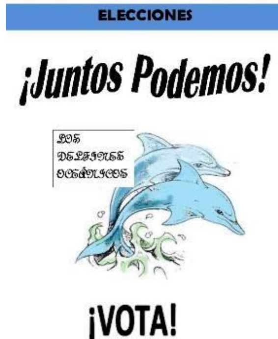
Imagen 7: panfleto electoral de los delfines oceánicos

La formación de los partidos políticos supuso una experiencia muy enriquecedora a nivel educativo, ya que los alumnos y alumnas de los diferentes grupos tuvieron que mezclarse, intercambiar opiniones y trabajar en equipo con el fin de alcanzar unos fines comunes. Cada partido se organizó de manera autónoma, eligiendo a un representante que defendiera su ideario con proyectos de mejora en su barrio y centro escolar. De los tres partidos políticos solamente uno presentó alguna dificultad para desarrollar estas propuestas lo cual, a nivel pedagógico, resultó muy positivo ya que estos desajustes ayudan a consolidar aspectos tan significativos a nivel educativo como la organización, saber delegar, o la responsabilidad y la comunicación entre los miembros de un grupo o equipo.