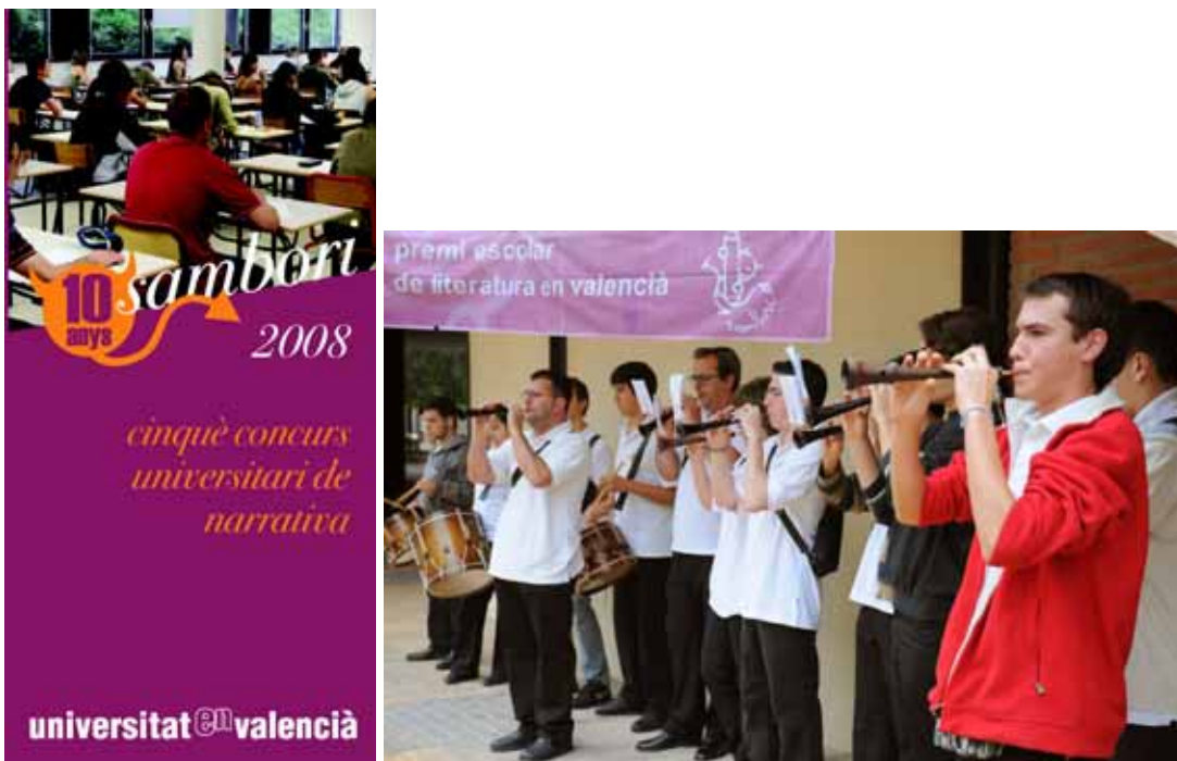
La colla de dolçainers del Campello, Larraix, dona la benvinguda als assistents a la festa del Sambori 2008, al Paranimf de la UA

En el marc de la col·laboració entre les universitats valencianes i la Federació Escola Valenciana, es va convocar la cinquena edició del Premi Sambori Universitari de narrativa curta destinat a estudiants de les universitats valencianes. Enguany la Universitat d'Alacant va acollir l'acte de lliurament dels premis als guanyadors