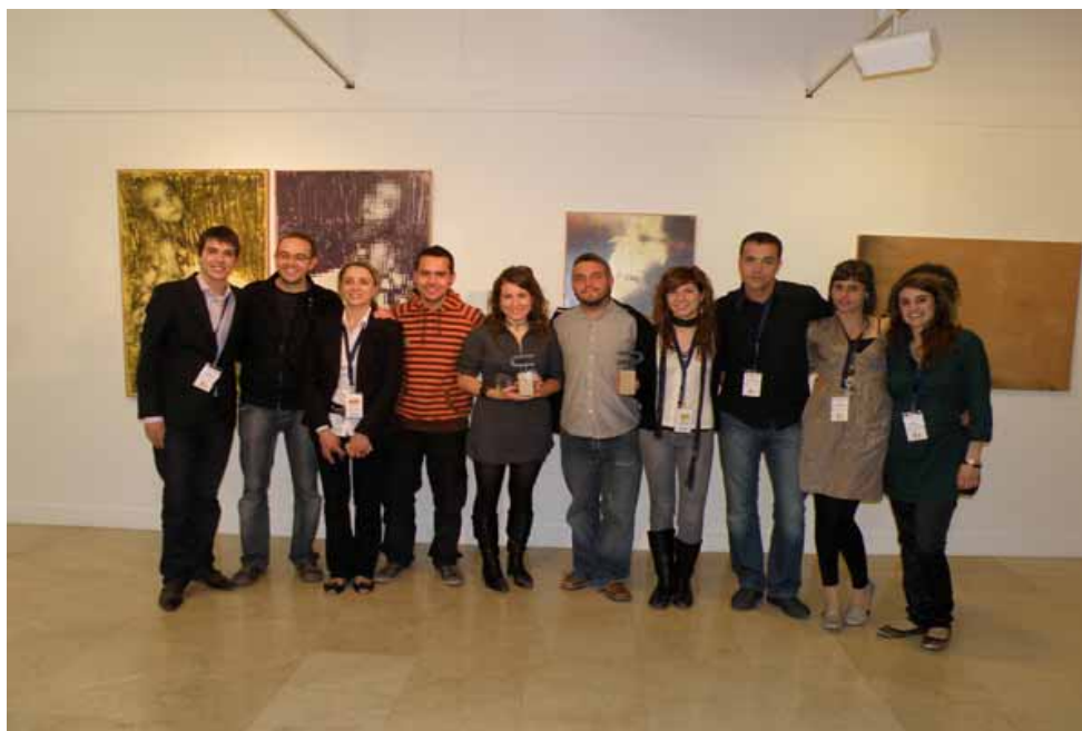
Els equips de la Universitat de Lleida i de la Universitat d'Alacant

La Universitat d'Alacant i la Universitat de Lleida van guanyar, ex aequo , el premi al Millor equip de la competició, premi que atorguen els mateixos equips participants en la Lliga de Debat.