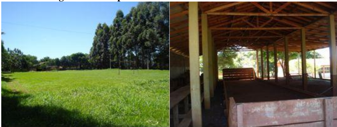
Autor: Estevan Coca. Data: 16/03/2010.