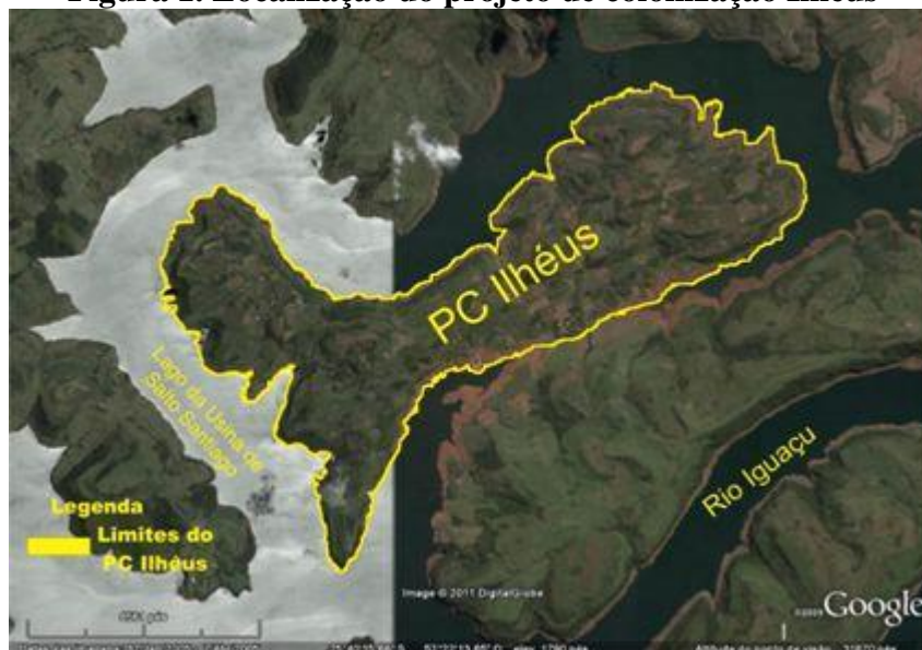
Figura 1. Localização do projeto de colonização Ilhéus

A média de cada lote é 14 ha, o que é considerado pequeno pelos ilhéus, já que no assentamento existe um relevo acidentado (Fotografia 1). Isso torna praticamente inviável a permanência de filhos e agregados no assentamento quando esses atingem a idade adulta.