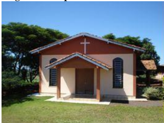
Autor: Estevan Coca. Data: 16/03/2010.