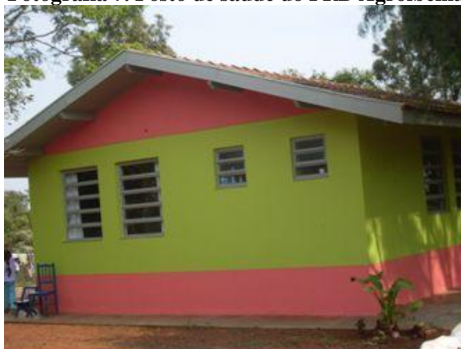
Autor: Estevan Coca. Data: 09/08/2010.

Estes exemplos demonstram, que nos reassentamentos o enfoque temporal da territorialidade é diferente se comparado com os assentamentos implantados pelo Incra. Isso porque no momento em que as famílias têm acesso a terra já existe uma estrutura mínima de lazer, saúde e religiosidade para que os reassentados sintam um impacto menor com a nova realidade que vivem após serem expropriados de suas terras e levados para outra localidade.