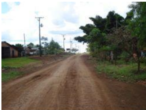
Autor: Estevan Coca. Data: 16/03/2010.

É importante salientar, que o estímulo a nucleação das famílias e a organização dos lotes em comunidades é uma prática incentivada pelo MST em nível nacional, como