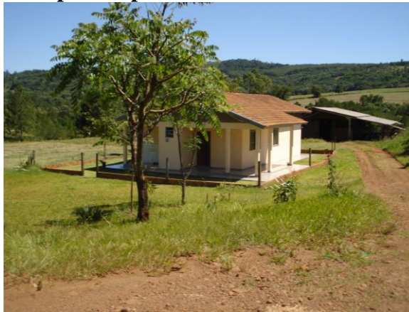
Datas: 16/03/2010.

Foi estabelecido, já no momento em que era negociada com a Copel a indenização das famílias atingidas pela construção da Usina de Salto Santiago, que os reassentamentos deveriam ser dotados de uma área onde seriam instalados espaços de lazer e religiosidade. Assim, tanto no Agroibema quanto no Três Barras, existe um área com igrejas, salão de festas e praças esportivas (Fotografias 5, 6 e 7).