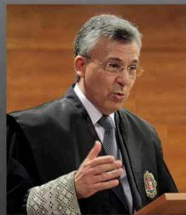
D. JORGE RABASA DOLADO Fiscal General de Alicante

RELACIÓN PADRES-HIJOS ADOLESCENTES Y LOS PROBLEMAS DE LAS REDES SOCIALES.